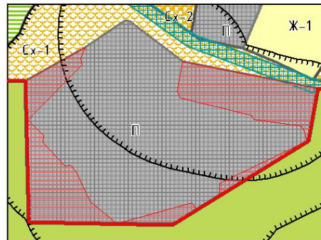
Рис. 2. Фрагмент карты после внесения изменений в ПЗЗ